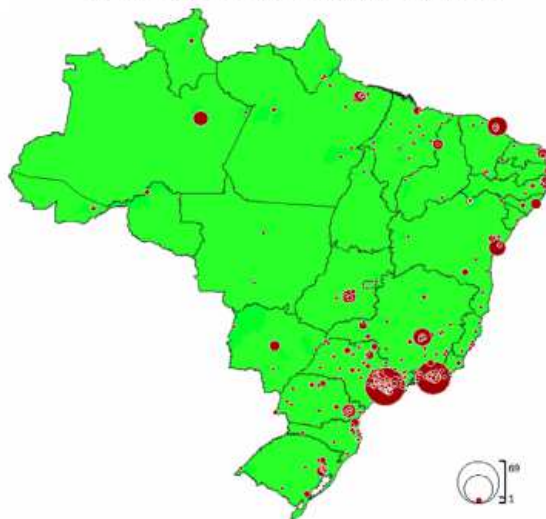
Mapa : Déficit de Conselhos Tutelares, por município, 2012